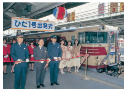
民営化当時の写真 「ひだ1号」出発式(1987年4月1日、名古屋駅)

国鉄の分割民営化以降、当社は、国鉄が担っていた公共的・社会的使命を引き継ぎながら、民間会社としての歩みを着実に進めています。