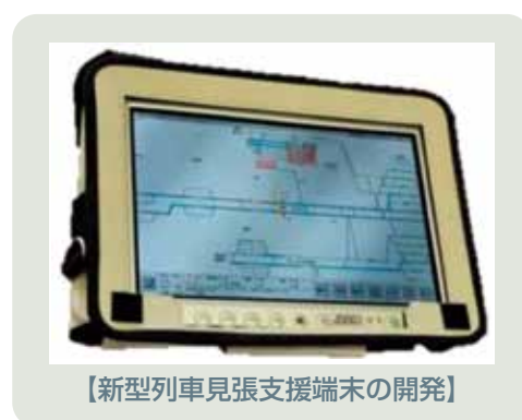
【新型列車見張支援端末の開発】

線路内作業の更なる安全確保のため、列車見張員が携行する列車見張支援端末を改良しました。最新のタブレット端末を採用することで、操作性が大きく向上するとともに、従来よりも大きなモニタで列車の走行位置や駅の到着番線を詳細に把握することが可能となりました。2023年からは紙に記載のダイヤに代えて最新のダイヤを端末に表示できるよう改良を行いました。