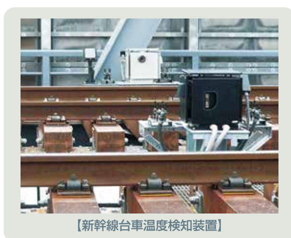
【新幹線台車温度検知装置】

在来線では、新幹線車両に搭載している「台車振動検知システム」をベースとし、台車のみでなく、動力伝達装置の異常の予兆も検知できる「振動検知システム」を開発しました。キハ25形2次車全車に搭載しているほか、315系やHC85系にも搭載しています。