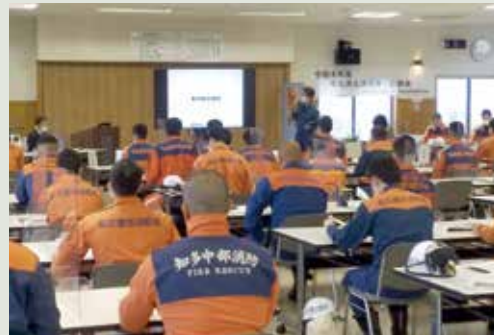
【当社社員による机上講習】