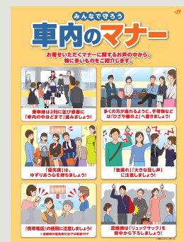
【乗車マナーアップポスター】

当社では、お客様に列車を快適にご利用いただくため、乗車マナーアップの各種取組みを実施しています。具体的には、駅・車内での啓発放送、ポスター掲出とお客様へのお声かけ、学校訪問などを実施し、乗車マナーの向上を広く呼びかけています。