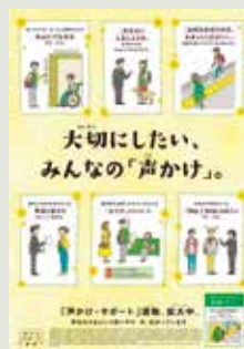
【お声かけポスター】

ホームからの転落防止等、ホームでのお客様の安全を確保するため、駅や車内での放送のほか、ポスター掲出や情報モニターの映像放映等を通してさまざまな啓発活動を継続的に実施しています。具体的には、お客様同士の思いやりのお声かけの呼びかけのほか、スマートフォンや携帯電話を使用しながらホーム上を歩くいわゆる「歩きスマホ」の危険性についての注意喚起、ホームで危険を認めたら非常停止ボタンを押していただくお願いなど、ホームの安全に関わる様々な角度から注意喚起やお願いを行っています。