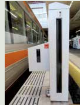
【在来線のホーム可動柵非常開ボタン】