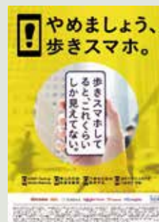
【注意喚起ポスター】