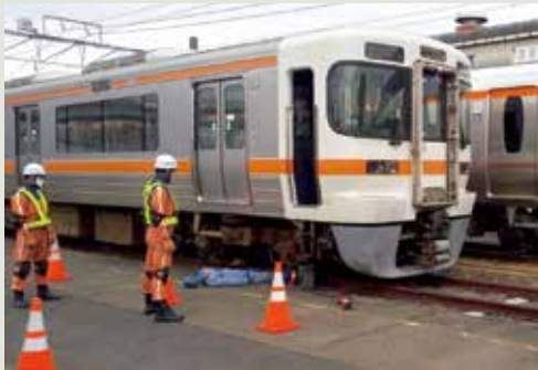
【救助隊員によるジャッキアップ訓練】

当日は、車両設備の取扱いや事故発生時の連絡体制に関する机上説明を行ったうえで、消防の資機材を用いた実車のジャッキアップ訓練を行い、消防救助隊員の車両構造知識の習得を図りました。