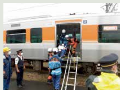
【災害救急救助訓練】

2022年9月1日、中津川駅構内において警察・消防と合同の災害救急救助訓練を実施しました。大規模地震の影響により走行中の列車が踏切内で脱輪した自動車と接触した想定で、乗務員による列車防護、指令等への連絡・打ち合わせ・報告、避難梯子を使用した車内旅客の救護・誘導、警察・消防と連携した負傷者の救出作業を実施し異常時対応力の向上を図りました。