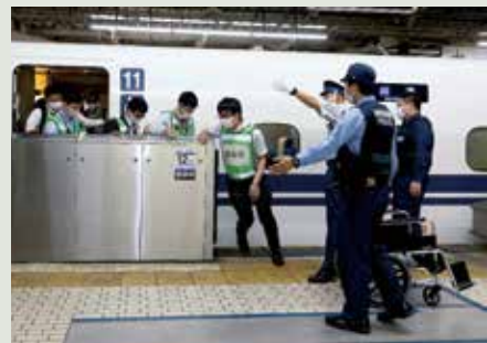
【警察と連携した不審者対応訓練】

2022年6月13日、品川駅～新横浜駅間を走行中の列車内で不審者が刃物を所持し暴れる事象が発生したとの想定で、駅で可動柵の開閉部とドアの位置がずれた状態で停車した列車からの避難誘導や駆け付けた警察官による不審者確保など、有事の際における警察との連携を確認する訓練を実施しました。