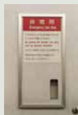
【在来線の非常用ドアロック設置例】