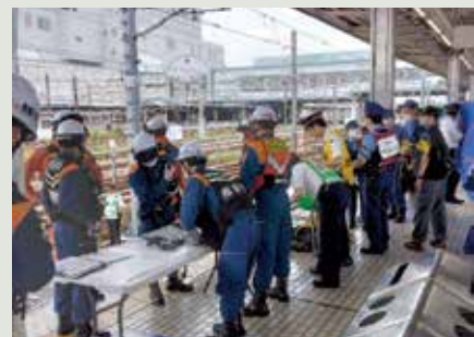
【警察・消防と連携した早期運転再開訓練】

線路内に立ち入った人と列車との触車事故が発生した場合、負傷者の救出や警察等の現場検証などにより運転再開までに多くの時間を要し、お客様に大きなご迷惑をお掛けする恐れがあります。そこで、このような事故が発生した場合にも、迅速かつ確実な対応により早期に運転を再開できるよう、2022年度も警察署や消防署と連携を図りながら、連絡体制や現場への立ち入り手順、負傷者の救出方法などを確認する訓練を実施しました。