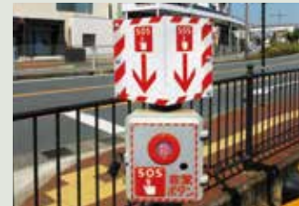
【非常ボタン（踏切支障報知装置）】

踏切内に車が立ち往生するなど、異常が生じた場合に、非常ボタン（踏切支障報知装置）の使用をお願いいたします。ボタンを押すことで関係する信号機に停止信号を表示させます。