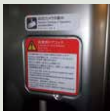
【新幹線の非常用ドアロック設置例】